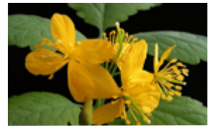
Grande chéloïde ou grande éclair Chelidonium majus Famille : Papavéracées Floraison : mai à septembre