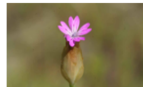
Œillet prolifère Petrorhagia prolifera Famille : Caryophyllacées Floraison : mai à septembre