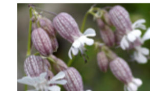
Silène enflé Silene vulgaris Famille : Caryophyllacées Floraison : avril à août