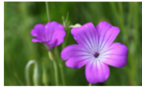
Nielle des blés Agrostemma githago Famille : Apiacées Floraison : juin à septembre