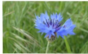
Bleuet des moissons Cyanus segetum Famille : Astéracées Floraison : mai à septembre