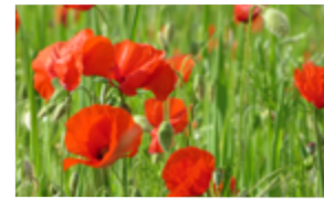
Coquelicot simple Papaver rhoeas Famille : Papavéracées Floraison : mai à juillet