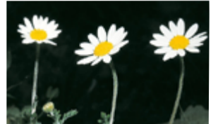
Anthémis des champs Anthemis arvensis Famille : Astéracées Floraison : juin à septembre