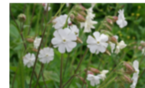
Compagnon blanc, Silène des prés Silene latifolia Famille : Caryophyllacées Floraison : juin à octobre