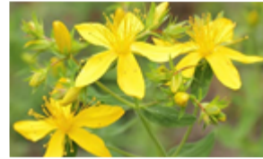
Millepertuis perforé Hypericum perforatum Famille : Hypéricacées Floraison : juin à septembre