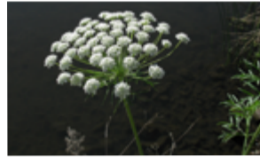
Grand ammi Ammi majus Famille : Astéracées Floraison : juillet à septembre