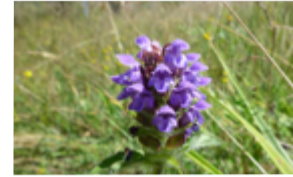
Brunelle commune Prunella vulgaris Famille : Lamiacées Floraison : juin à octobre