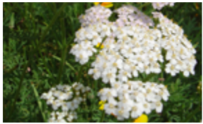
Achillée Millefolium Achillea millefolium Famille : Astéracées Floraison : juin à septembre

Ce mélange de graines est composé d'espèces végétales produites en France.