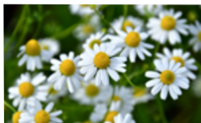
Camomille romaine Chamaemelum nobile Famille : Astéracées Floraison : juin à août