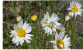
Grande marguerite sauvage Leucanthemum ircutianum Famille : Astéracées Floraison : juin à octobre