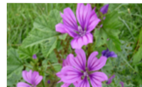
Grande mauve Malva sylvestris Famille : Malvacées Floraison : mai à septembre