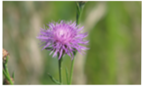
Centauree jacée Centaurea jacea Famille : Astéracées Floraison : juin à septembre