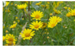
Chrysanthème des moissons Glebionis segetum Famille : Astéracées Floraison : juin à septembre